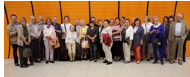
Gyülekezeti találkozó Heilbronnban – 2014 július 20.-án