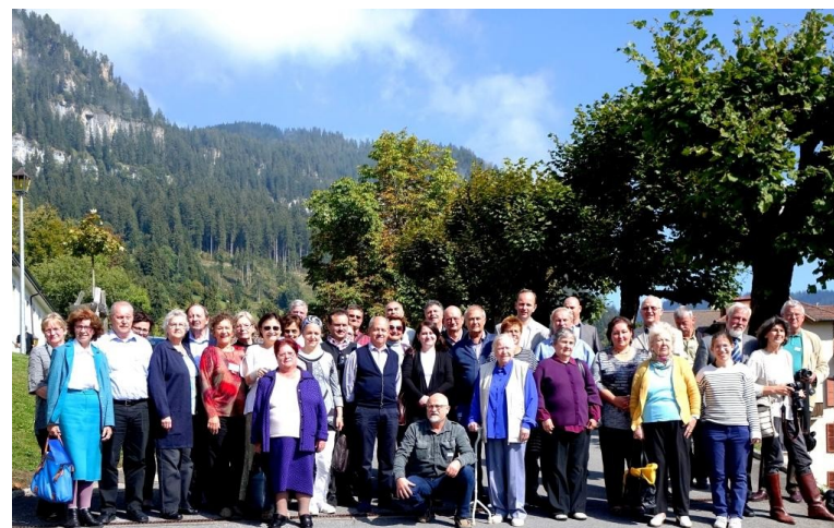
(Csoportkép a beatenbergi konferenciáról)